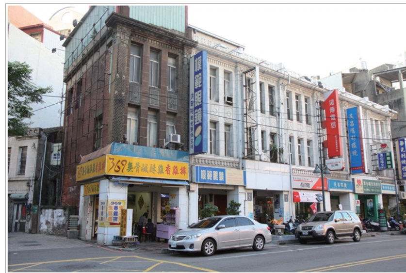
八卦園大旅社現已沒有營業改為出租當店家

民國六十七年中山高速公路通車，政府開始建設道路，小西街布業集散地的地位，開始受到衝擊，客源漸漸的流失，使得小西街面臨了沒落的挑戰。